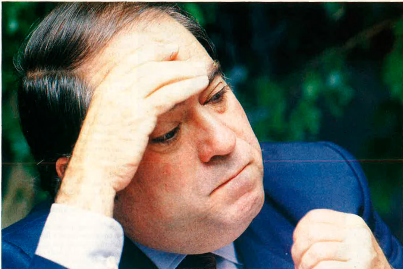
"En la política hi ha un component d'hipocresia molt elevat".