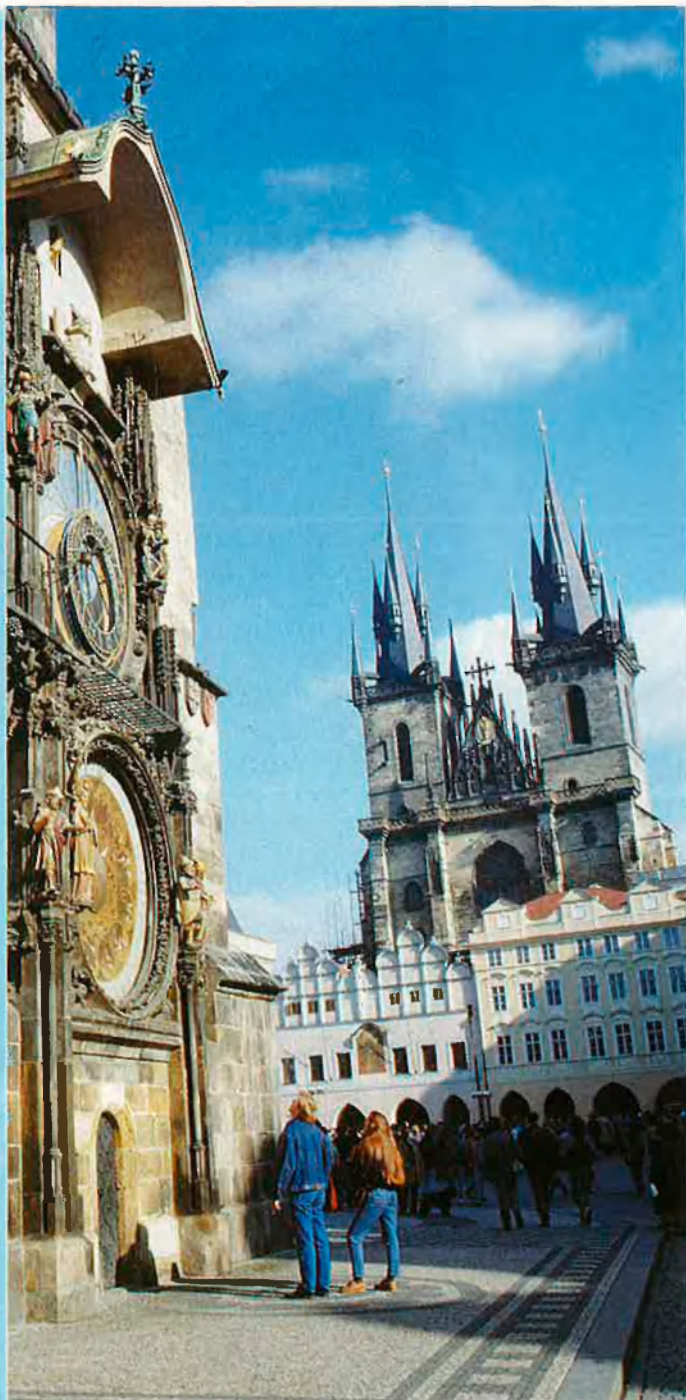
Praga, la ciutat malenconiosa.

Locals. Els dos cafès més clàssics de la ciutat són l'Slavia (Narodní, 1) i l'Europa (en l'hotel del mateix nom). L'U Flekú (Kremencova, 11) és la cerveseria més antiga d'Europa. L'òpera al Teatre Nacional i les representacions escèniques de la Llanterna màgica i el Black theatre són de visita obligada.