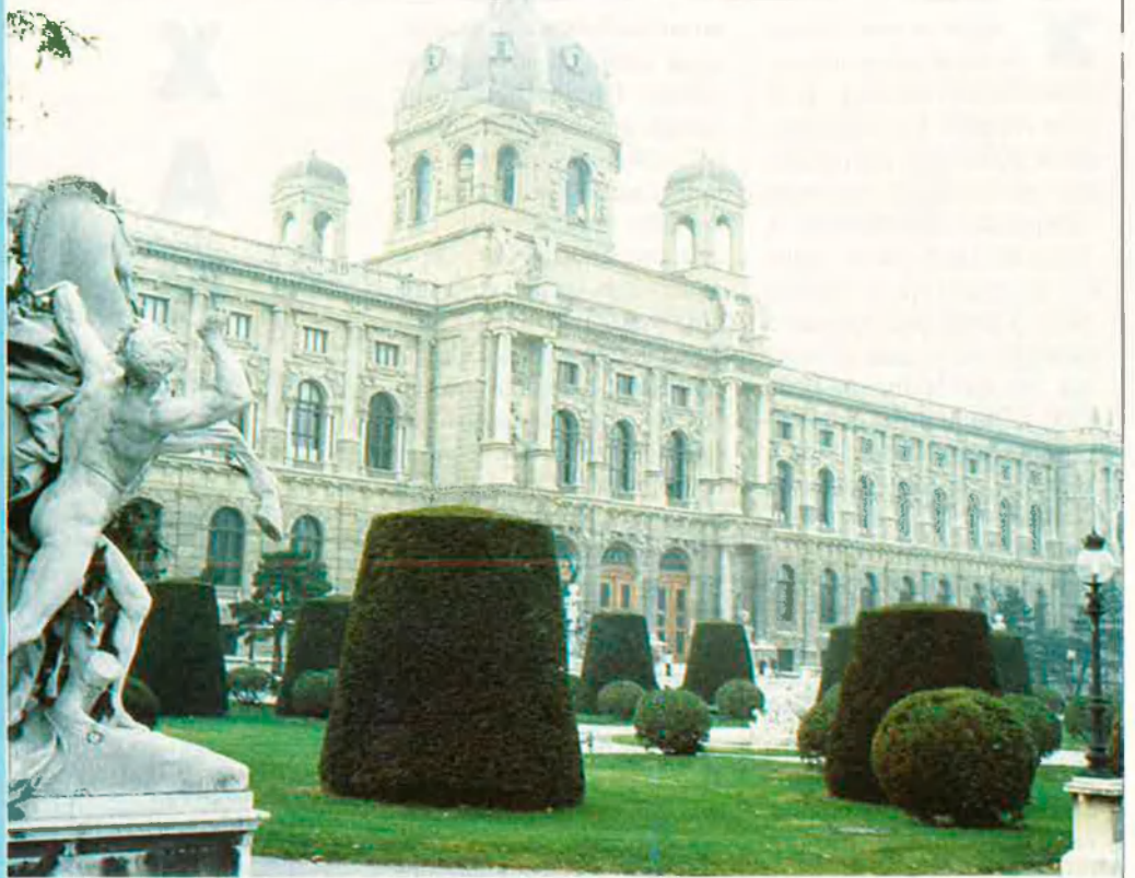
Viena, al cor d'Europa.