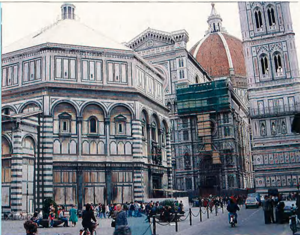
Florència, la bellesa del Renaixement.

Locals. A Florència es poden tastar els millors gelats d'Europa. Dues bones geladeries són la Vivoli (via Dell'Isola delle Stinche, 7) i la Gelateria (plaça Santo Spirito). Durant l'estiu és recomanable assistir a les actuacions musicals que es fan a l'aire lliure a la plaça Della Signoria. El Space Electronic (via Pazzualo) és una interessant sala de festes amb aquaris plens de piranyes.