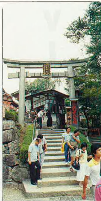
Xangai, la ciutat més diferent de la Xina