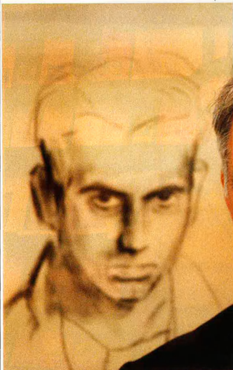
"Un artista ho és en la mesura que allò que és ell ho és també la seva pintura".

—Es tracta d'una novel·la amb argument propi il·lustrada amb imatges de Tàpies. He intentat interpretar Tàpies com a pretext i Tàpies com a protagonista. Com a pretext per explicar la creació artística, en abstracte, amb l'ús que fa de les pròpies contradiccions i, a partir d'aquestes, establir el seu llenguatge. I a través d'un quadre dels anys seixanta que es diu Paradís perdut , on hi ha un àngel que tampoc és un àngel, que ex-