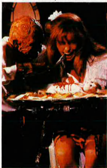
El popular Freddy Krueger fent pràctiques d'odontologia.

podem trobar amb autèntiques joies plenes de destrellats visuals i argumentals.