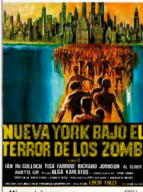
Més sang i vísceres.