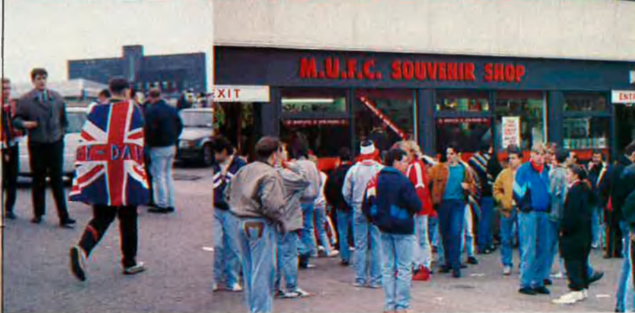
Hooligans, més que mai.