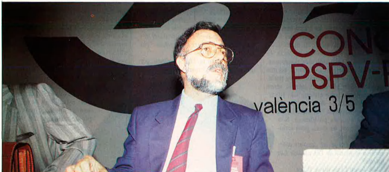
"La dreta podria arribar fins i tot a fusionar-se".