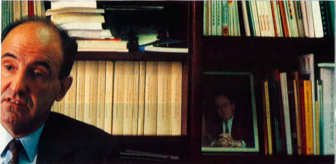
"Ningú m'ha ofert mai ser candidat a l'alcaldia de Barcelona".