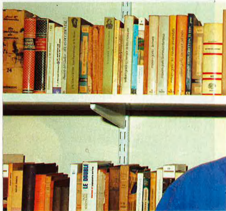
"D'infraestructura teatral, anem fatal".

— Des d'alguns sectors s'ha qüestionat la funció dels centres dramàtics.