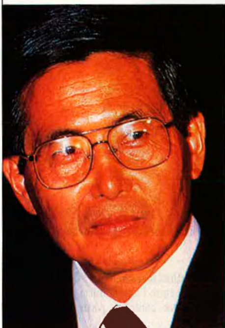
Alberto Fujimori ha fracassat en l'intent de moralitzar la política i la justícia.

Grans desigualtats socials, narcotràfic, guerrilla; el panorama que presenten els països d'Amèrica Llatina és esfereïdor i els sistemes polítics de la nova democràcia sembla que no són capaços de millorar la situació.