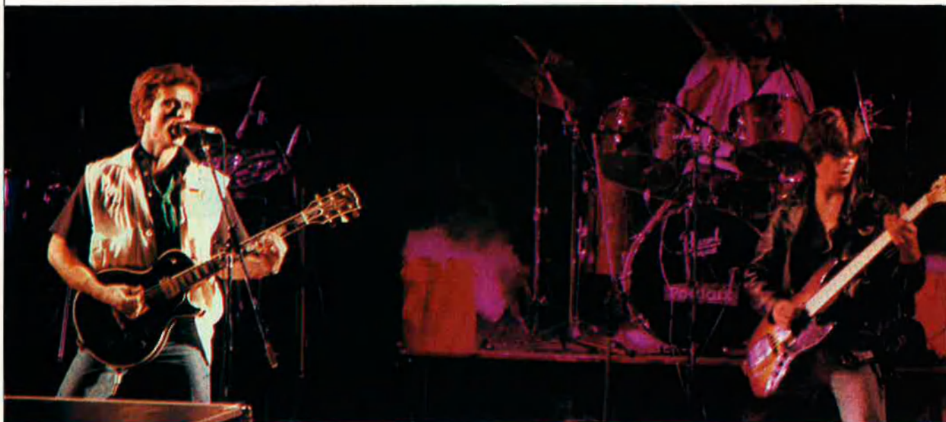
Pantaix en la festa de EL TEMPS.