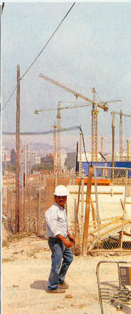
Les constructores es reparteixen el pastís olímpic.

La inversió calculada (privada i pública) del total d'obres que se'n realitzaran -tot i que algunes d'elles no seran acabades fins a més tard de la celebració dels