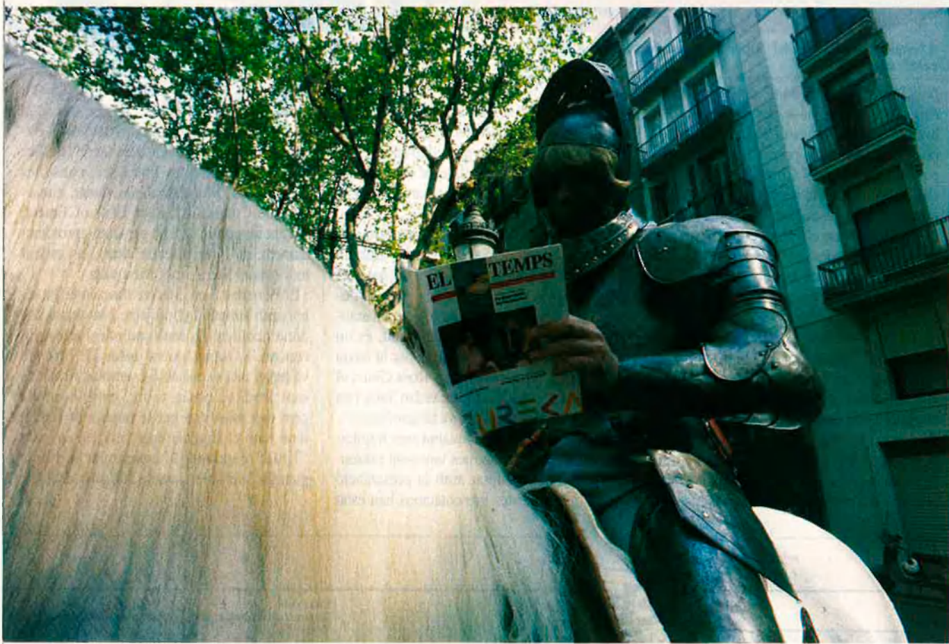
El cavaller Tirant, de la mà d'EL TEMPS i de les institucions patrocinadores, va fer acte de presència el 23 d'abril en la rambla.

Només 24 hores després d'aparèixer als quioscos EL TEMPS amb el primer número dels suplementes de Tirant lo Blanc , la resposta col·lectiva ja podia qualificar-se de molt favorable. Tot un rècord.