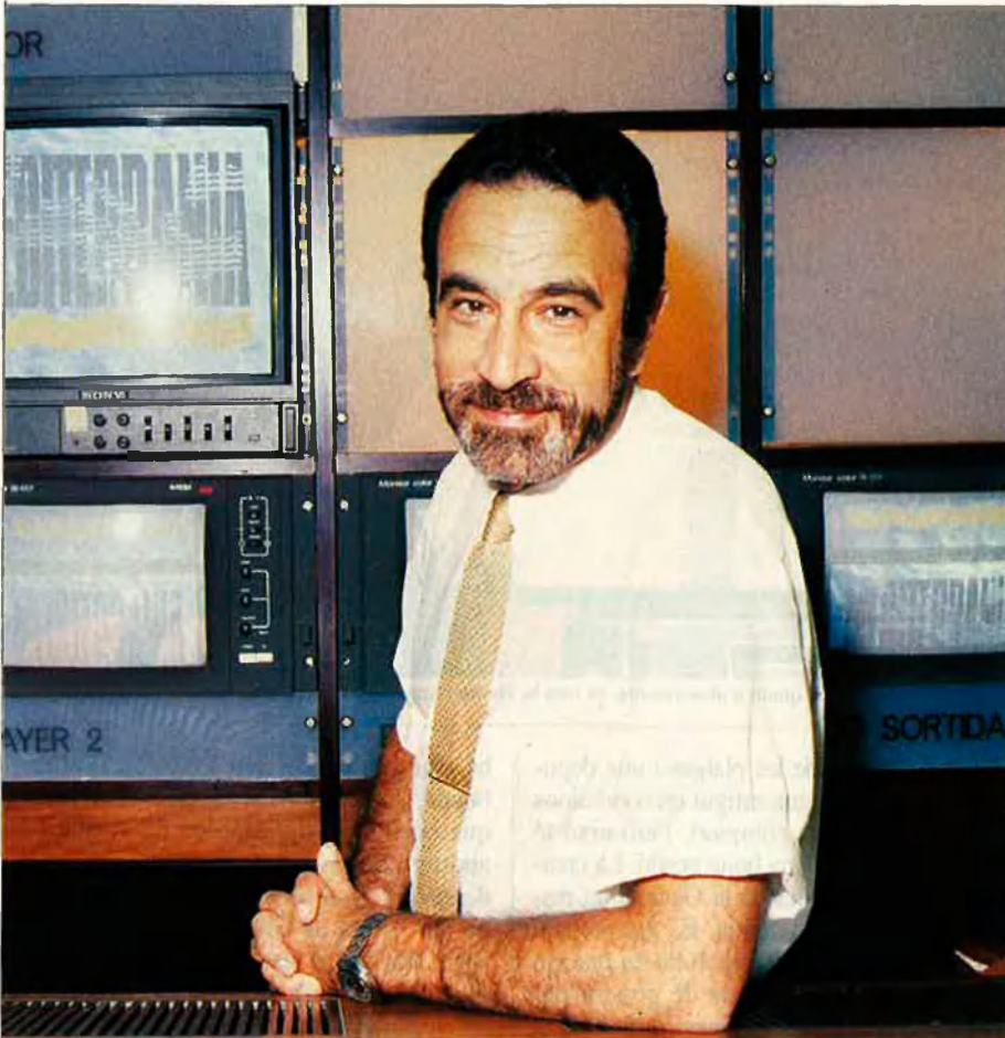
"No es pot permetre que una companyia insolvent pugui posar en perill tot el turisme de la Riviera italiana".