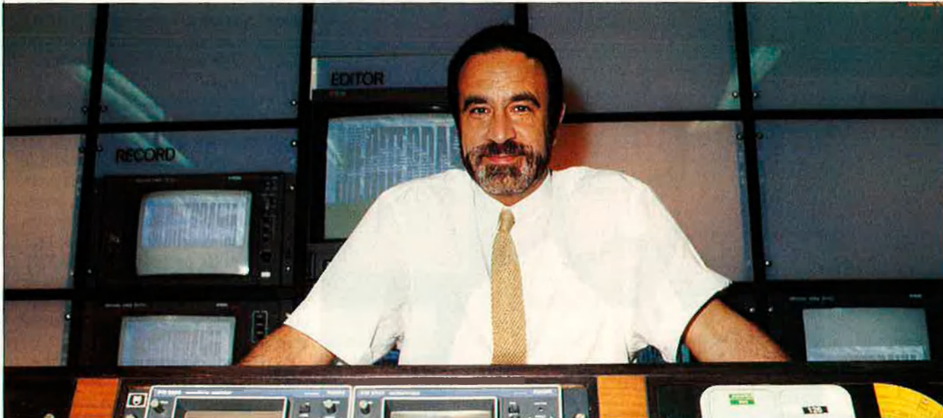
"Hi ha un arc que va de València a Gènova, que és la part més maltractada, quant a abocaments, de tota la Mediterrània".