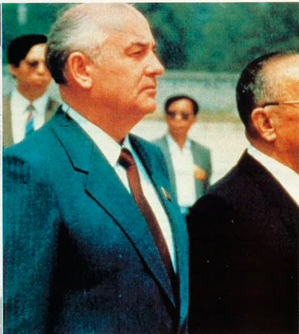
Gorbatxov al Japó.

La població edificada pels pioners soviètics, dalt d'un turó sobre el mar, no és sinó un conjunt de barracons de fusta amb teulades de quitrà. Ni un monument, ni un campanar no s'alcen al cel.