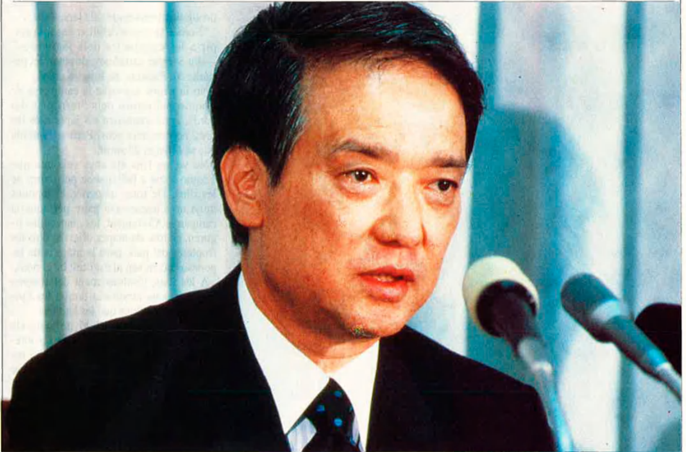
Els kurilesos s'oposen a abandonar territori soviètic.