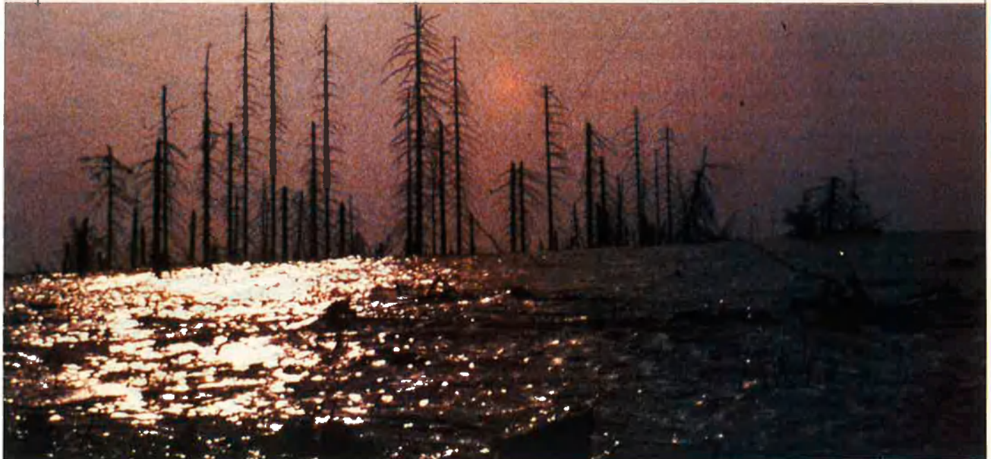
La protecció institucional de la natura ha rebut nombroses crítiques.

D'altra banda, als Estats Units, funciona des de fa vint anys l'Agència del Medi Ambient -EPA-, que depèn directament de l'executiu. Una de les seves característiques importants és que quan fa llistes de productes tòxics, són les empreses les que han de demostrar que utilitzen