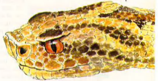
Cap d'escurçó europeu ( Vipera aspis ). Dibuix E. Huguet.

Hi havia també qui pensava que els cabells arrancats amb arrel i posats en aigua es convertien en serps, i en confirmació d'això contaven el cas d'una jove molt bonica que un dia sense adonar-se es va engolir un cabell que se li convertí dins del ventre en una serp. La família, en advertir la grandària del ventre de la noia, en comptes de pensar que tenia una serp dins el ventre va creure coses