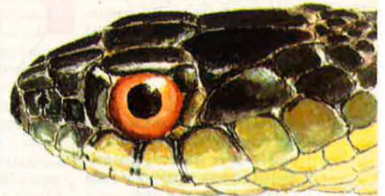
Cap de colobra de collar ( Natrix natrix ). Dibuix E. Huguet.

pitjors, i per evitar la deshonra la va abandonar en la muntanya. La pobra xiqueta, sens dubte innocent del crim de què l'acusaven, indefensa, sense sabates ni aliments, va caminar dies i dies per la muntanya, i ja es pensava perduda quan un pastor la va salvar. Un bon home que