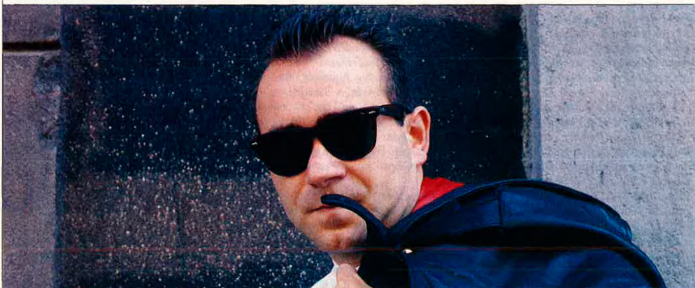
"València està bastant fotuda però jo no sóc ni el salvador ni Superman".