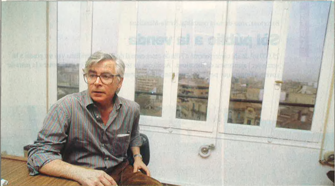
"Els nous periodistes em fan molta pena. No sé per què trien aquesta professió. Ací no es guanyen calés, sinó antipaties i enemics".