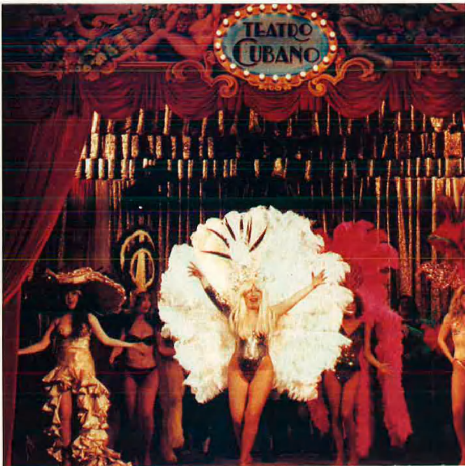
“Nosaltres al cap i a la fi el que fem és teatre”.

cansat de la seua passivitat de sempre i que només uns quants actors privilegiats puguin actuar?