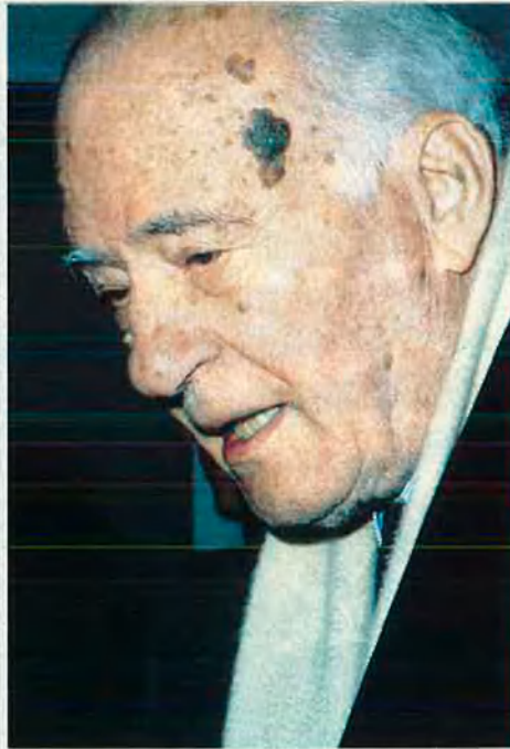
Lluís Companys i Josep Tarradellas, els altres presidents d'ERC. La Humanitat , un dels òrgans principals d'ERC.