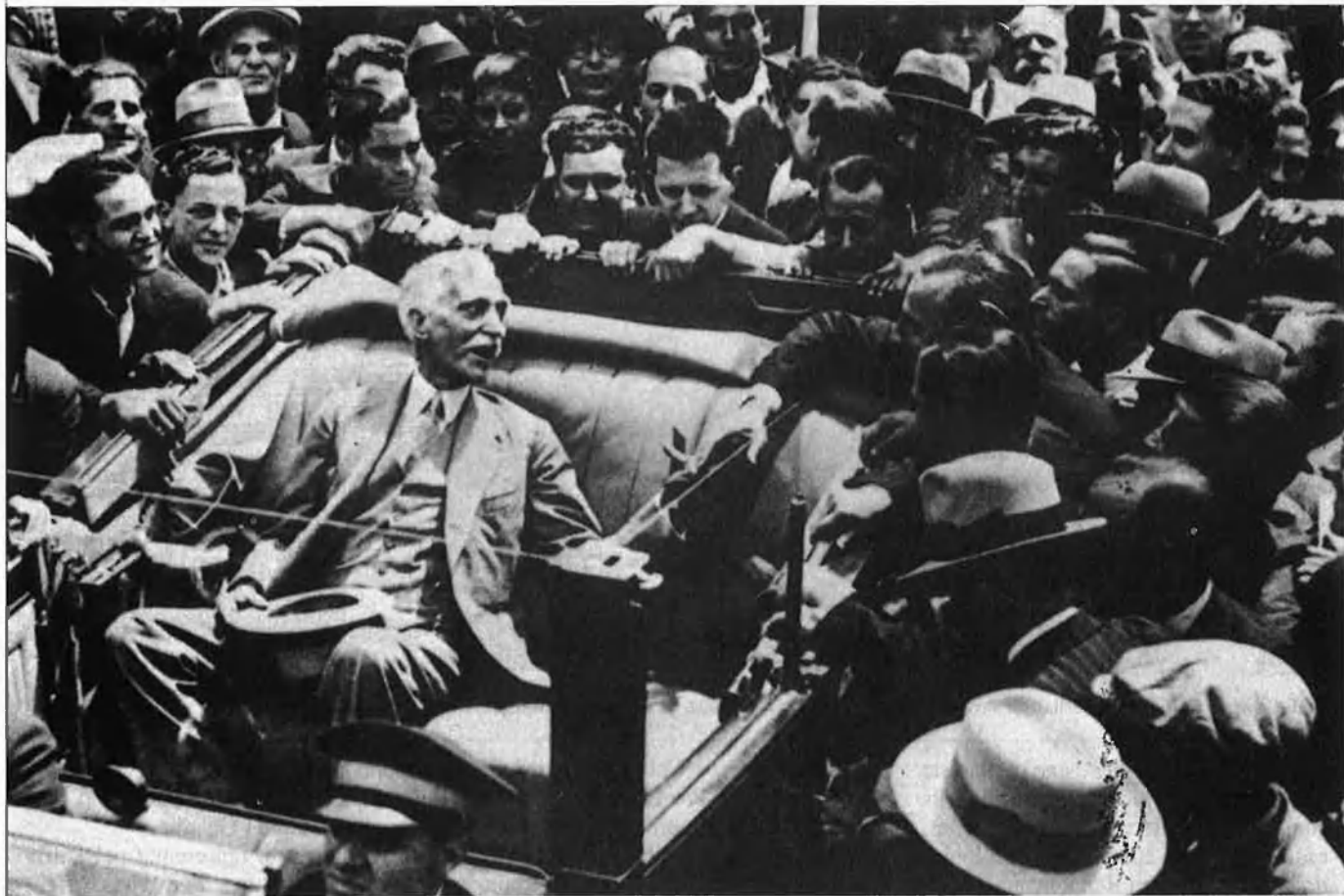
Francesc Macià, l'avi, va crear la Federació Democràtica Nacionalista 14 anys abans de la fundació d'ERC.