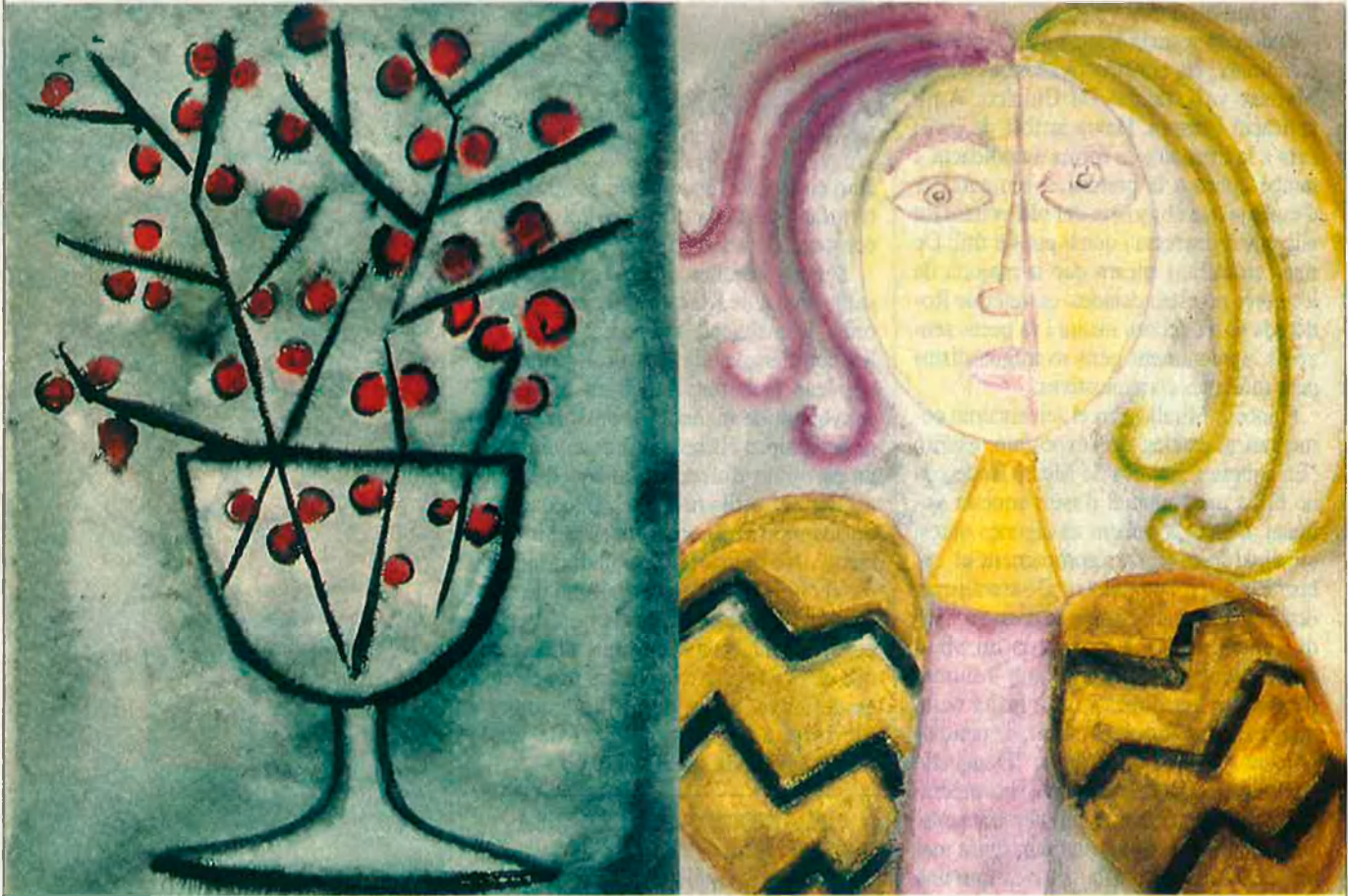
A l'esquerra, Coupe et cerises , aquarel.la. A la dreta, Aquarel.la/paper .

L'exposició que a partir d'aquest dissabte 16 de març es pot veure al casal Altarriba de Vic, a quatre quilòmetres de la capital de la Plana, té més d'un punt d'interès. El primer és, sense dubte, descobrir la Rodoreda pintora. Després de la seva mort