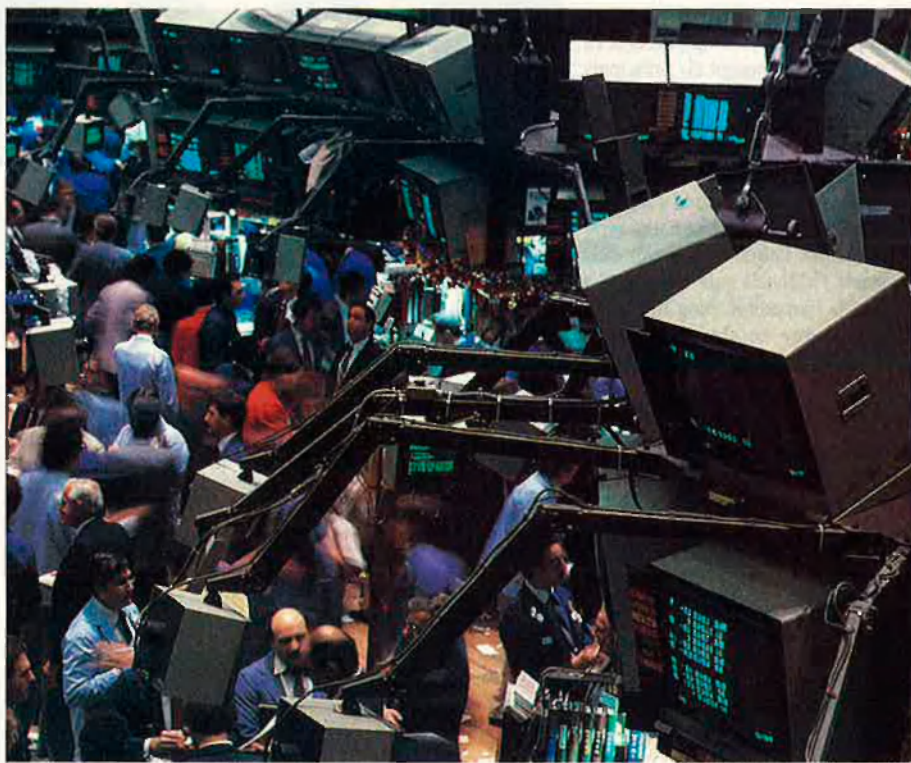
1993 serà un any perillós per a l'economia nord-americana.