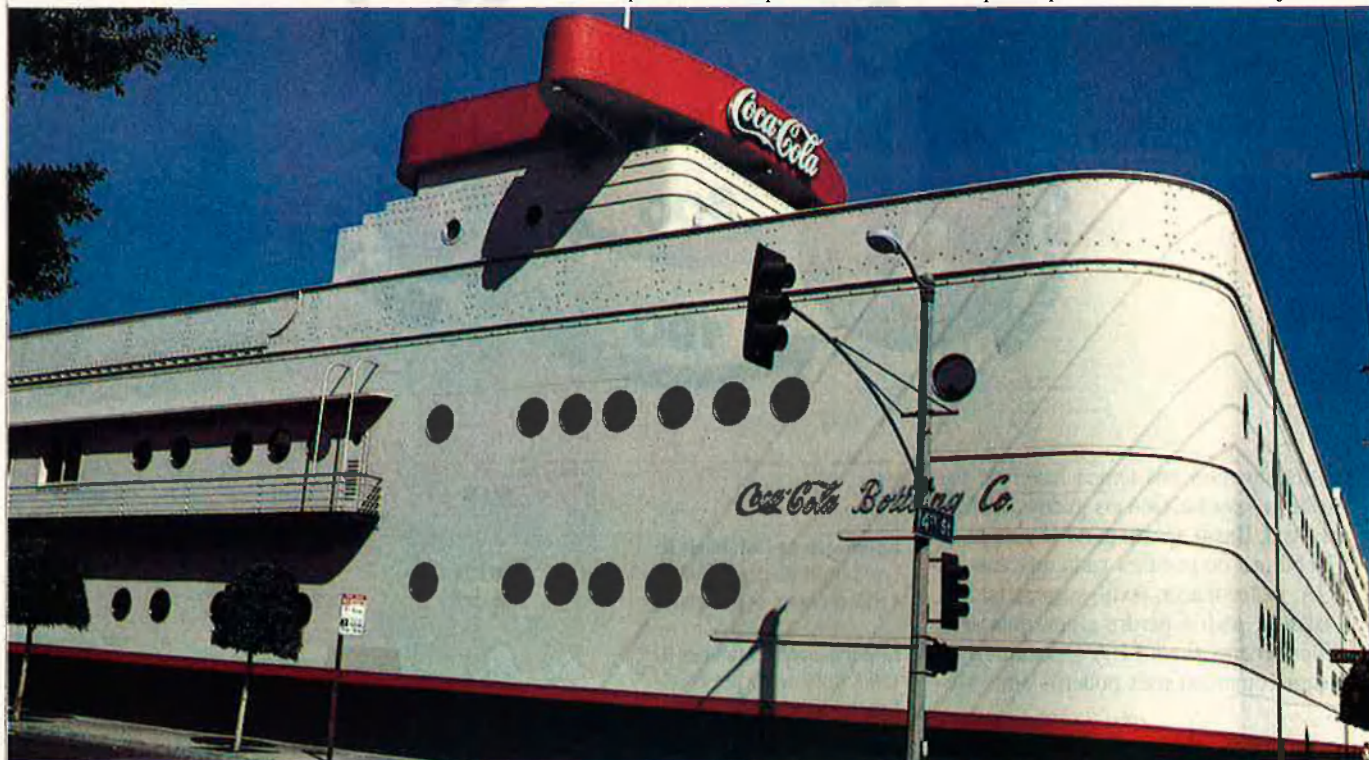
L'economia americana es beneficiarà d'aquest nou esquema de comerç.

Els qui estan tractant d'arribar a un acord comercial tindran dificultats perquè Mèxic obri la seva indústria del petroli al comerç i a la inversió estrangera donat que molts mexicans contempen l'empresa pública Petroleos Mejianos