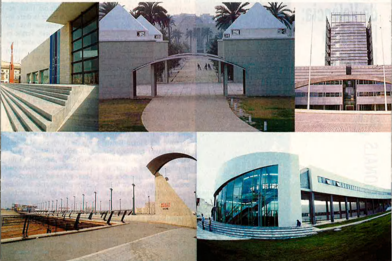
IVAM. Autors: E. Giménez i Carles Salvadores. Tram I i II del Jardí del Túria. Autors: Veges Tu i Mediterrània i J.J. Barquero. Centre de producció de Programes de TVV. Autors: Veges Tu i Mediterrània i H. Fernandez. Pont Nou d'Octubre. Autor: S. Calatrava. Centre d'acollida de menors. Castelló.

A l'IVAM s'ofereix una mostra de la més recent arquitectura valenciana.