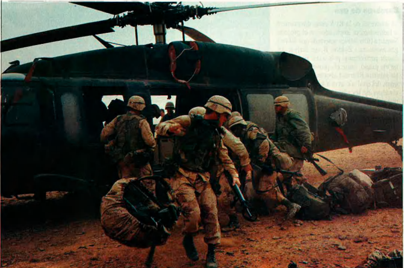
Iraq va fer proves amb el gas zykon amb presoners de guerra iraquians.