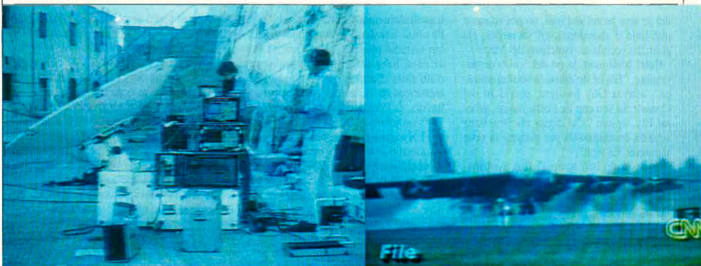
Durant els anys 70 i 80 el Mossad va estar molt actiu.