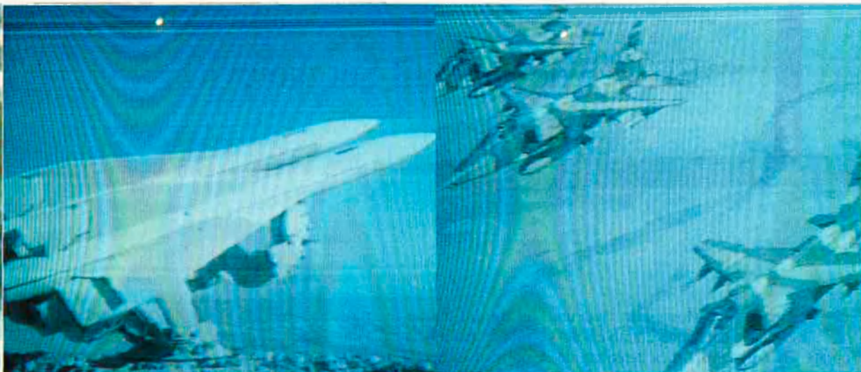
Les paraules de l'ambaixador americà poden fer creure a Saddam que les diferències entre Iraq i Kuwait seran considerades un afer interàrab.