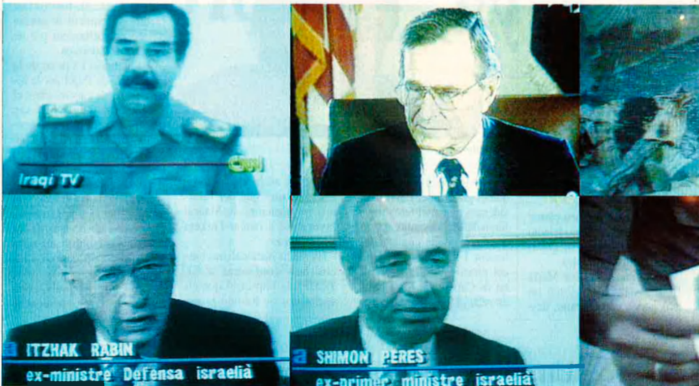
Tot aquest afer sembla més una novel·la d'espies.

Tot va començar a París, en el secret més absolut. Un relat, gairebé de novel·la d'espies, de les causes que ens han portat fins la guerra del Golf.