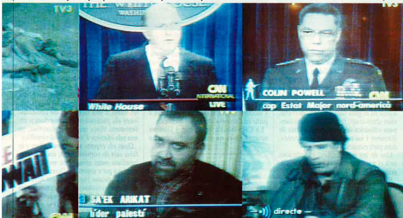
La col·laboració entre París i Tel-Aviv va funcionar sense problemes fins el 1960.

S'enceta, doncs, la construcció d'un reactor a Dimona, al desert del Neguev.