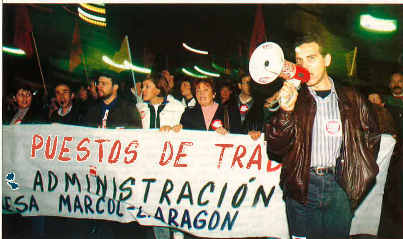
Els treballadors han organitzat al llarg de la setmana passada manifestacions i mobilitzacions.

Va ser una de les societats pioneres en el comerç modern de grans magatzems. Quaranta-sis anys després de la seva creació, les portes de l'empresa, amb 1.200 treballadors, estan a punt de tancar definitivament