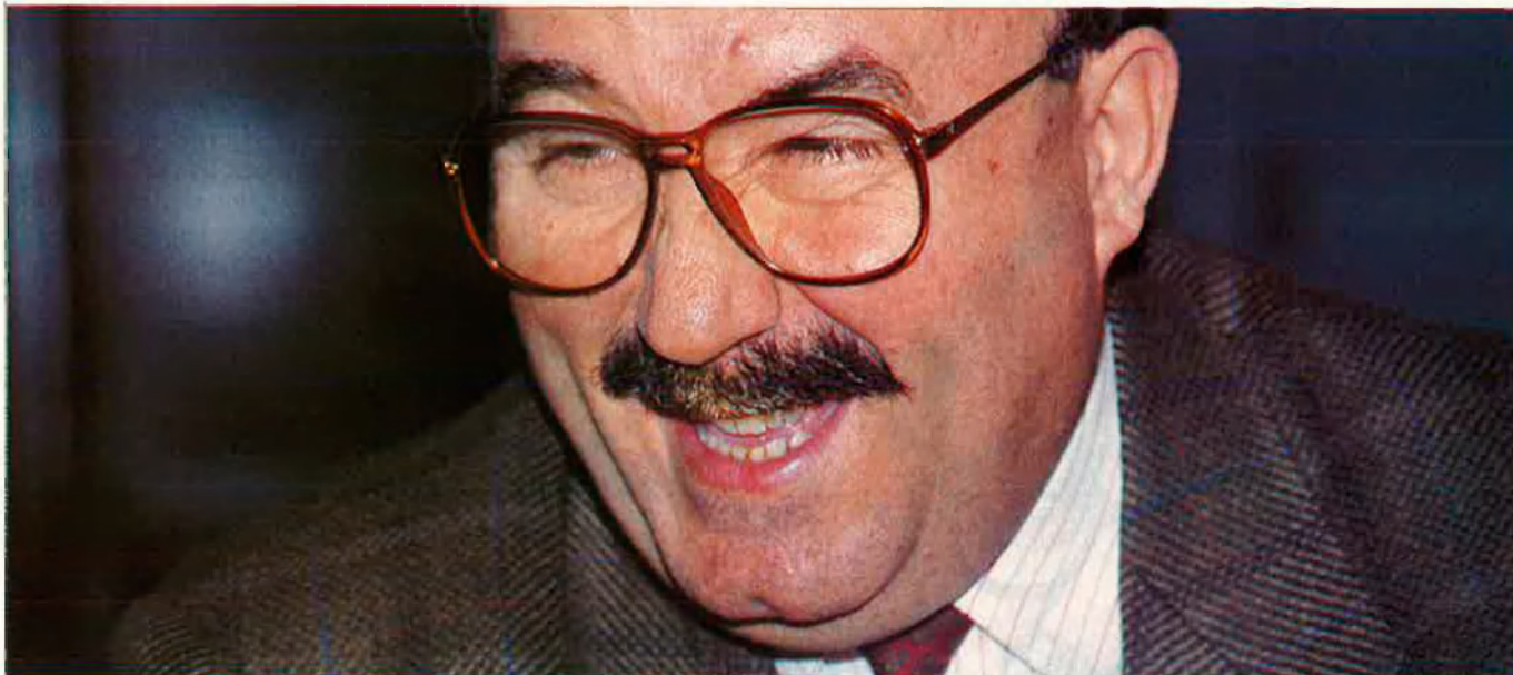
"Tindrem policia autonòmica a la gallega".