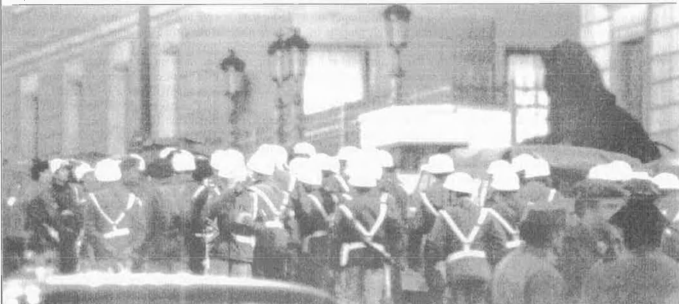
Membres de la policia militar entren al Congrés.