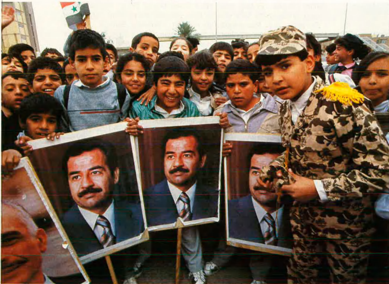
Hassan té una noció clara del que vol: mantenir-se al poder.

De totes les forces estacionades en els llocs de pas dels iraquians, se sap que van combatre amb seguretat els soldats de Qatar (un petit emirat del Golf) i els kuwaitians. Des de darrere, però, van haver d'esperar l'arribada dels saudites i els nord-americanes perquè ells no podien parar l'ofensiva tots sols. La postura dels marroquins no ha estat oficialment explicada però corren diversos rumors inquietants.