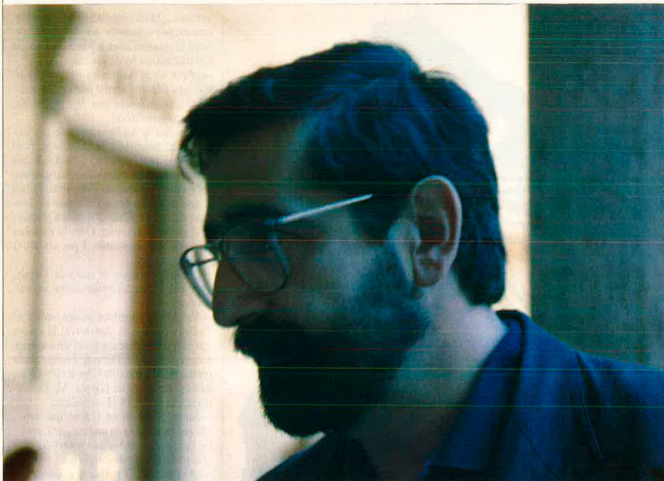
"Els salts tecnològics en el terreny de les comunicacions han complicat la vida a les nacions petites".