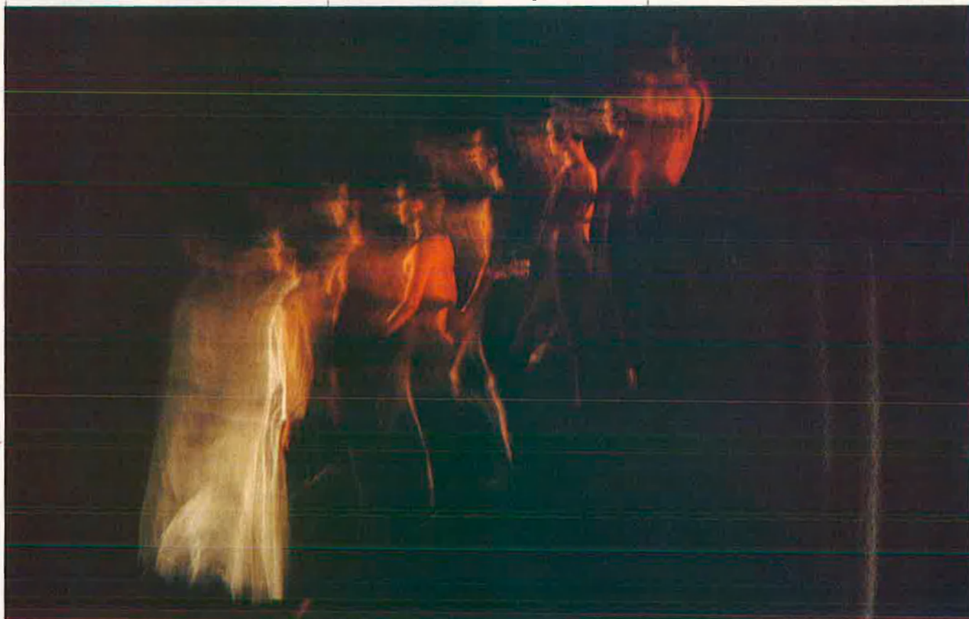
La dansa contemporània, entre el boom i la precarietat.

Novament la ciutat de València serà l'escenari del festival "Dansa València" que arriba a la quarta edició. La cita, que tindrà lloc entre els dies 13 i 16 de febrer, acollirà una sèrie de noms de l'ac-