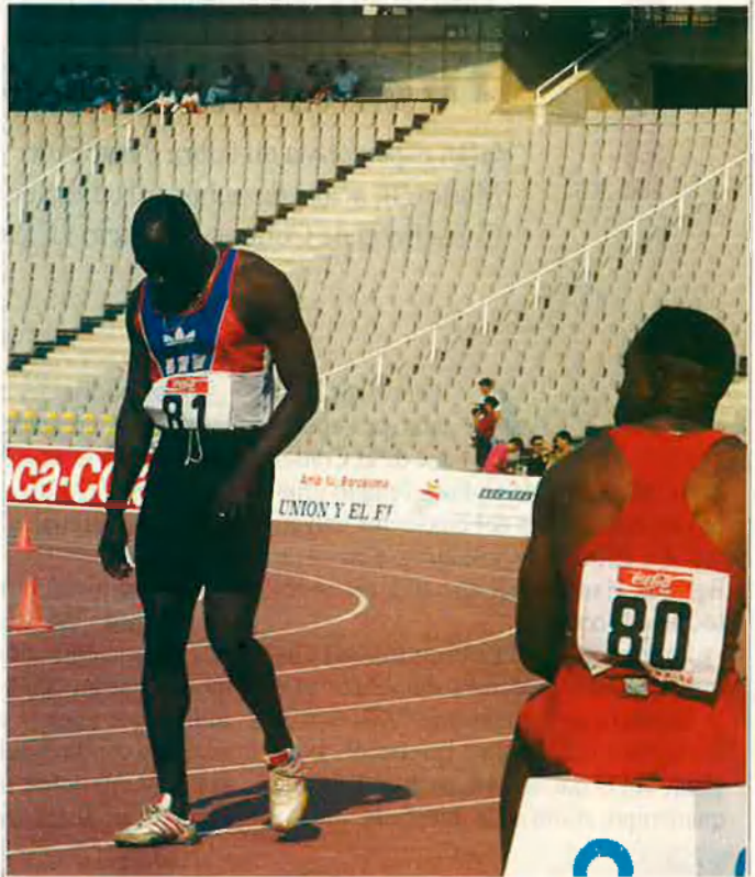
Els Jocs segueixen la mateixa evolució que els va fer morir a l'antiga Grècia: l'adoració als vencedors.

Per aquest motiu (el tema econòmic, francament, també hi ha influït lleugerament) EL TEMPS ha decidit no entrevistar Ben Johnson, per molt candidat que sigui a recordman de Barcelona'92 i per molt que se'l disputin Sevilla i Barcelona per muntar un gran combat de circ amb Carl Lewis, valorat en 1.000 milions de pessetes en publicitat. Comprar a preu d'or mitja horeta de la vida de Johnson, (amb tota la morbositat d'un ídol de fang i recordman en el consum d'anabolitzants) i haver de dissimular i demanar-li la seva opinió sobre les meravelles del gas natural de Barcelona, la versió de Pla interpretada per Flotats, o la mare de Mataró entestada a tenir una filla perquè li renti els plats, és més aviat humiliant. El lector, acostumat al consum de droga dura (acusacions, desa-