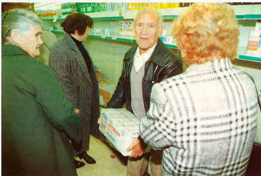
Després de l'esglai, els supermercats han tornat a la normalitat.

La psicosis de guerra feia que a Perpinyà, tal com indica el nostre correspon-