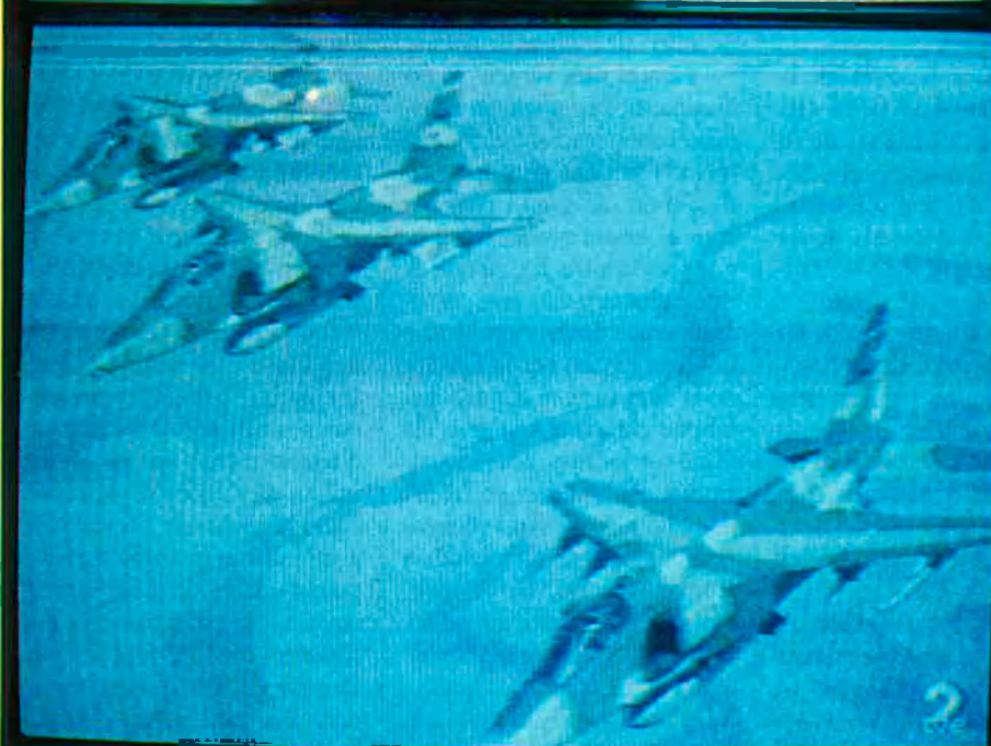
Totes les cadenes del planeta van connectar amb la CNN.