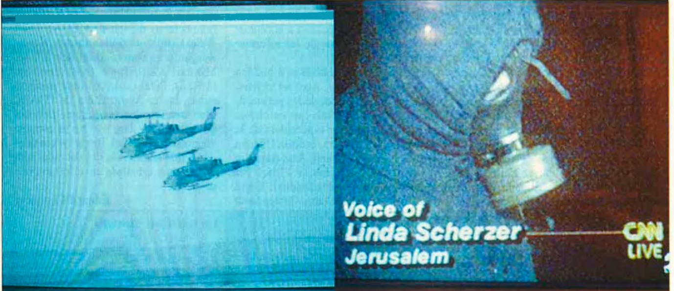
"Gràcies a la CNN, els EUA no han tingut carta blanca per a arrasar Bagdad.