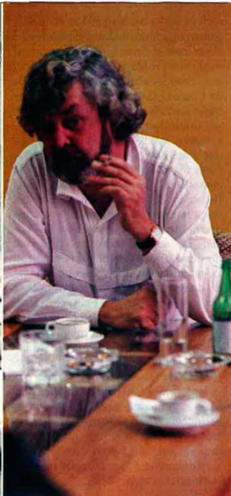
Nogueira i Beiras, l'esquerra nacionalista no es posa d'acord.