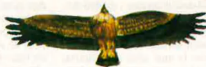
Siluetes de vol del voltor comú.

Avui, sia per l'acció directa dels caçadors, sia per la destrucció del seu hàbitat, veure volar un voltor és quasi un privilegi. Però continua sent un espectacle difícil d'oblidar.