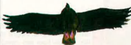
Siluetes de vol del voltor negre.

en perill. Fonamentalment, el voltor negre, del qual s'ha reduït en els darrers anys el seu nombre entre un 25 i un 50%. A més, durant anys, totes dues espècies han estat un dels blancs preferits dels caçadors, i avui encara en reben agressions. El naturalista valencià Antim Boscá comentava, l'any 1916, en el seu llibre Fauna valenciana , l'existència a la col·lecció de la Universitat d'un magnífic mascle de voltor negre dissecat, "derribado