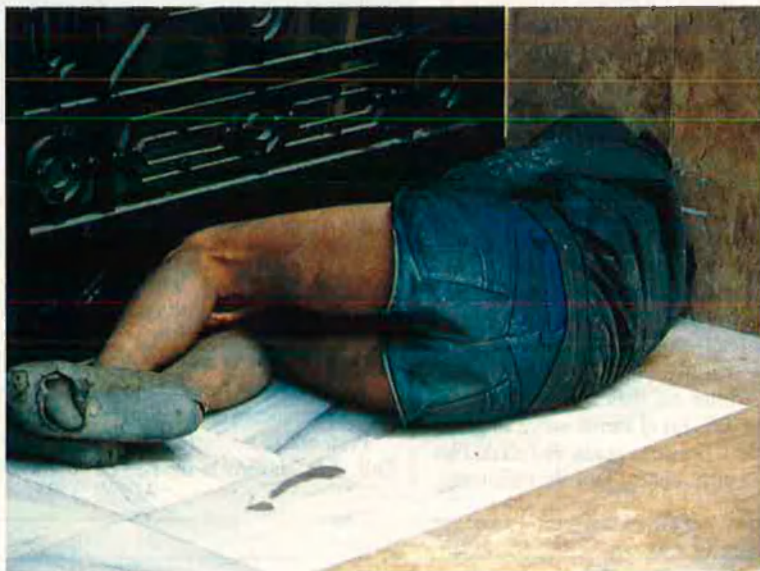
Els pobres, la frontera més salvatge de la societat.