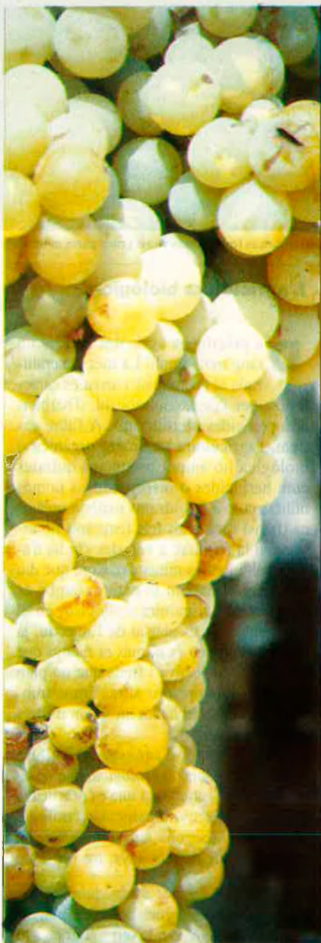
H. Lorenzen: "L'agricultura ecològica es dóna a petita escala".

També proposem que s'inclouï en el reglament un concepte qualitatiu de pro-