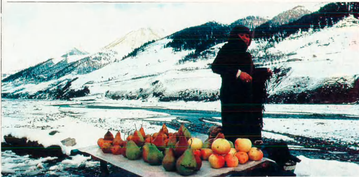
La venda ambulante està convertint-se en una activitat econòmica de pes en tot l'URSS.