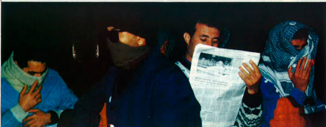
A Vila-real el tancament va ser producte d'unes decisions espontànies, d'una situació desesperada.

Un grup de treballadors marroquins es van tancar la setmana passada en una església de València i una altra de Vila-real davant la seua precària situació i l'amenaça d'expulsió del govern.