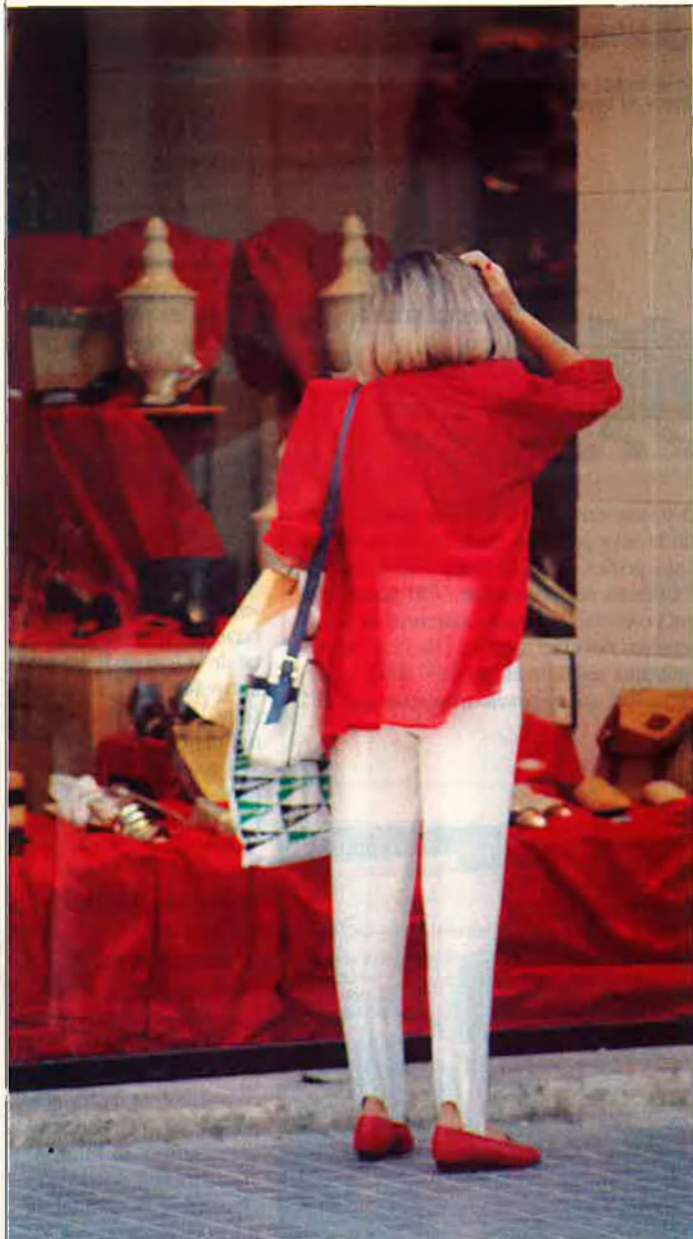
La gent gasta tot el que guanya.