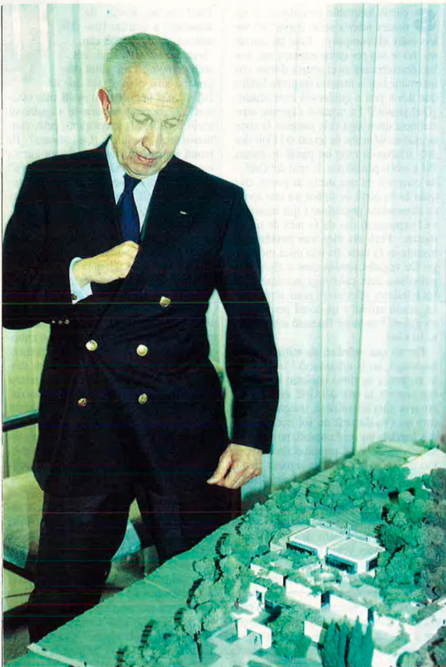
Joan Antoni Samaranch: "L'inaugurarem a la primavera del 1993".

"Ser elegit president del màxim organisme esportiu del món no és fàcil, ser reelegit tampoc, i tampoc no ho és retirar-se en el moment oportú, però jo ho faré el 1993", va assegurar l'estiu de