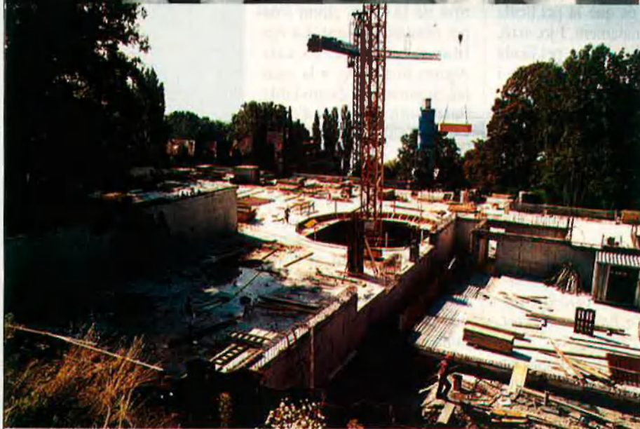
Arquitectes: Jean Pierre Cahen i Pedro Ramírez Vázquez.