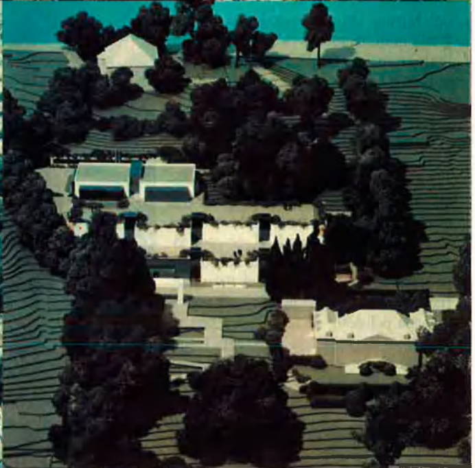
El museu també agruparà la biblioteca, el centre d'estudis olímpics, la fototeca i el departament àudio-visual.