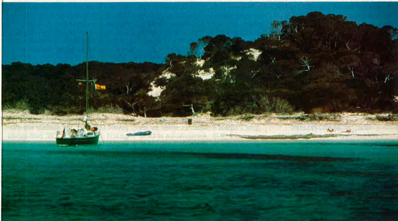
Platja d'Es Trenc (Mallorca).