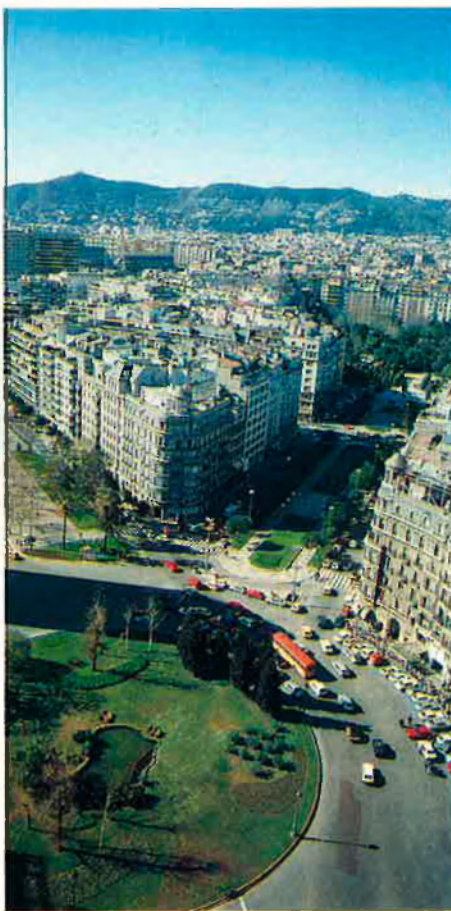
Objectiu: la capitalitat.

El govern de Madrid acceptava implicar-se en la realització d'algunes infraestructures claus de la ciutat: l'Auditori de Barcelona, el Museu d'Art de Catalunya, l'Arxiu de la Corona d'Aragó i una encara indefinida Biblioteca Pública de Barcelona. Més de 10.000 milions de pessetes són el global d'una inversió que no només es concentra a Barcelona —inclou també una participació en el futur Museu de Tarragona i en la biblioteca pública de Lleida— però de la qual es desconeixen els costos polítics. En qualsevol cas, es fumava una pipa de la pau que trobaria una resposta municipal immediata.