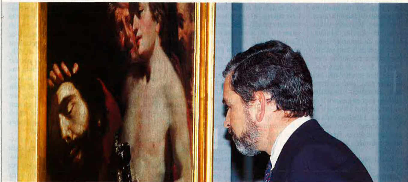
Al PSPV han estat tallats tots els caps crítics.

Amb el lema "La força del socialisme", el màxim òrgan entre executives dels socialistes valencians es reunirà els dies 14, 15 i 16 d'aquest novembre al Palau de la Música de València. Ningú espera cap sorpresa. Serà la victòria definitiva de Joan Lerma i Alfonso Guerra.