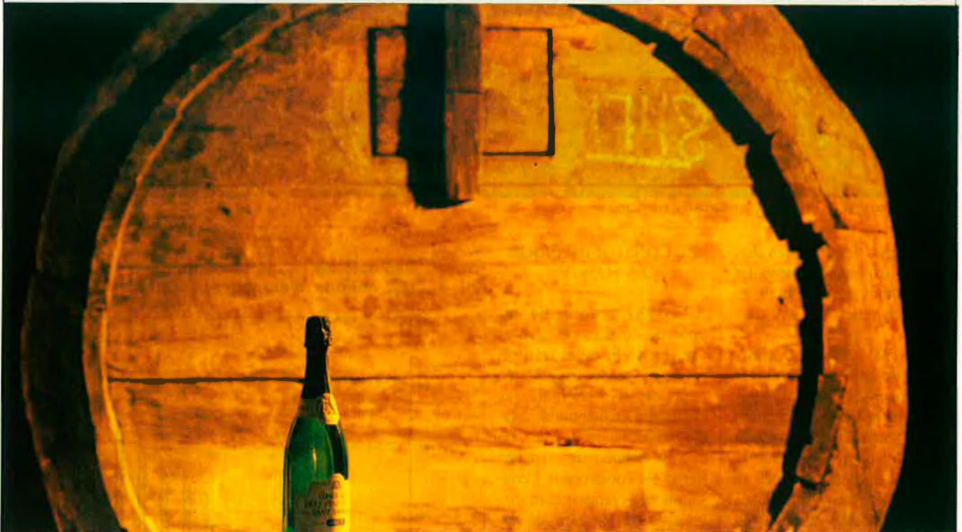
El cava deixarà de ser el vi festiu per a convertir-se en un vi habitual.

El sector s'aboca a la conquesta del mercat europeu amb l'objectiu de consolidar-se i penetrar als països de l'Est.