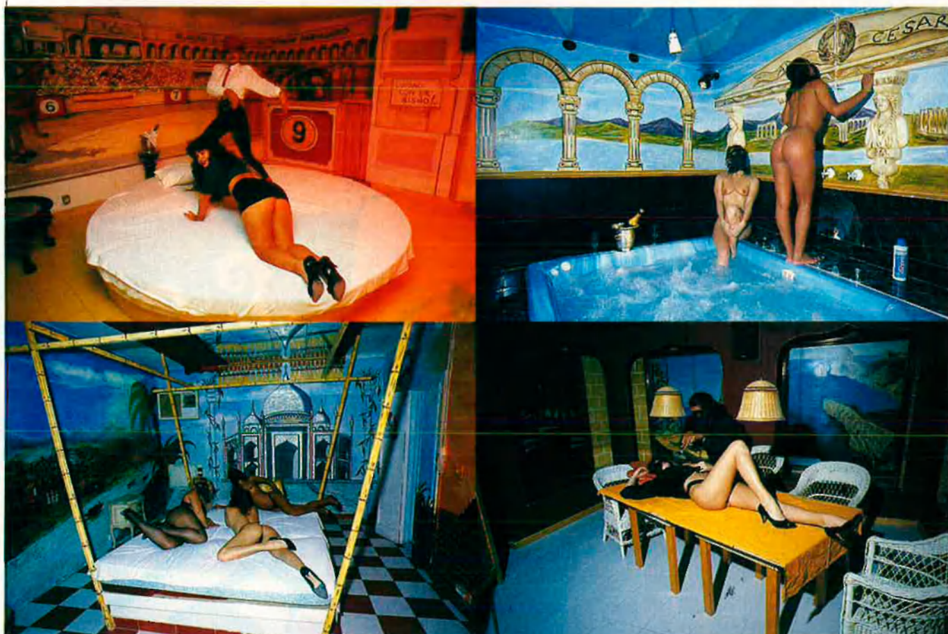
Només per a cavallers majors d'edat.

A Palma funciona des de fa uns anys un local de diversió que ofereix el que fins ara era totalment desconegut. En un sol local ball, copes, menjar i, si de cas, sexe, configuren una oferta totalment original.