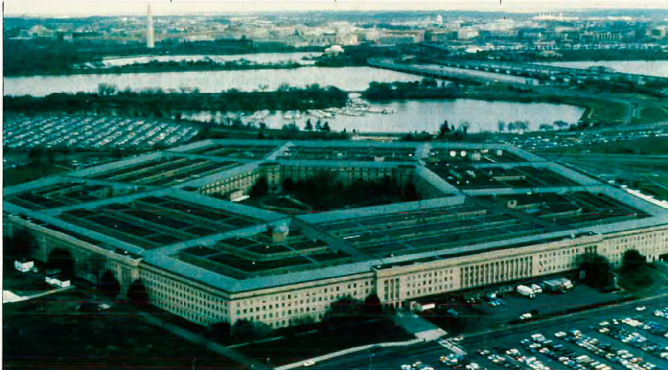
El Pentagon, despatx comú per a l'OTAN i la CIA.