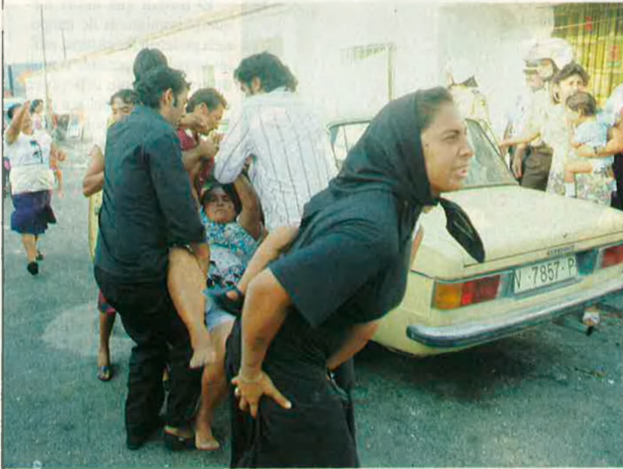
Traslladar la població gitana sol agreujar encara més el problema de la seua situació.

A Holanda actua l'organització racista Centrumdemokraten (CD), el dirigent de la qual Hans Janmaat va ser elegit diputat el 1989; el passat març, el CD va aconseguir regidors en onze ajuntaments. El grup neonazi Jongeren Front té un regidor a l'ajuntament de la Haia.