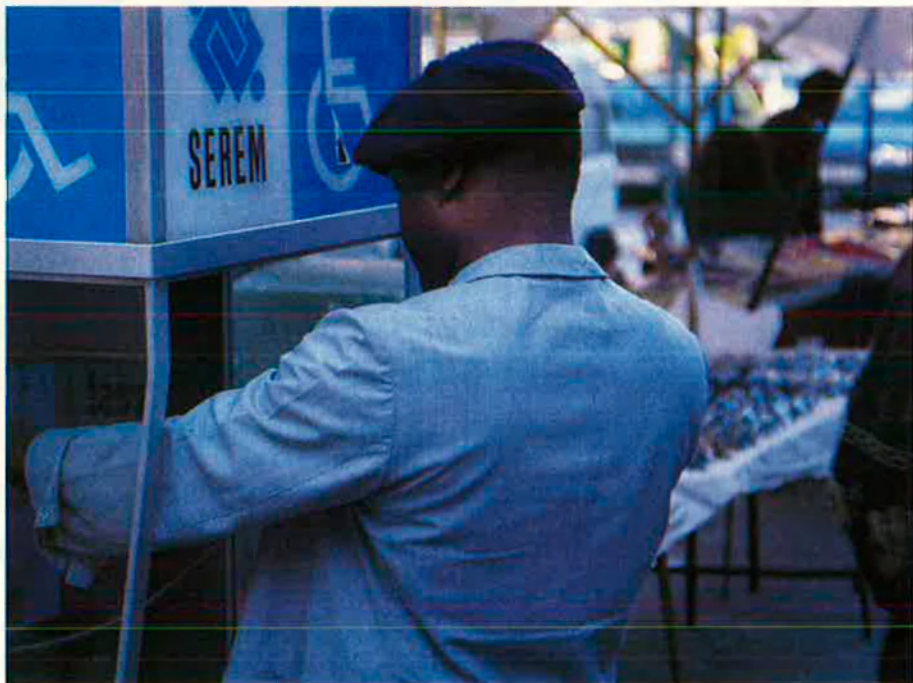
Ser diferent comença a ser molt perillós a Europa.

A Bèlgica, per exemple, entre 1985 i 1988 es van presentar, d'acord amb la llei contra el racisme, 519 querelles i 469 van ser rebutjades. Entre el 87 i 88 només es van produir quatre petites sentències condemnatòries, en una de les quals, a més, el condemnat va ser un negre que va dir racista a un polític conservador.