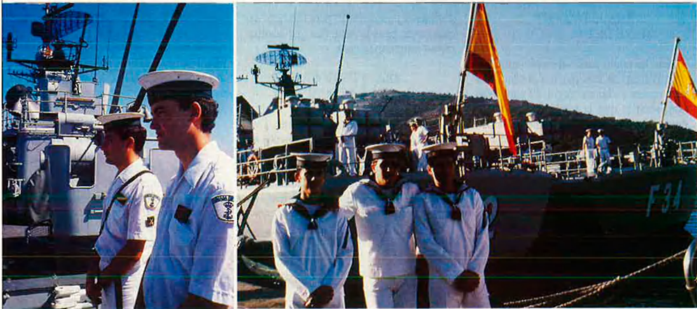
"L'avia em proposà l'escapada, que desertés".