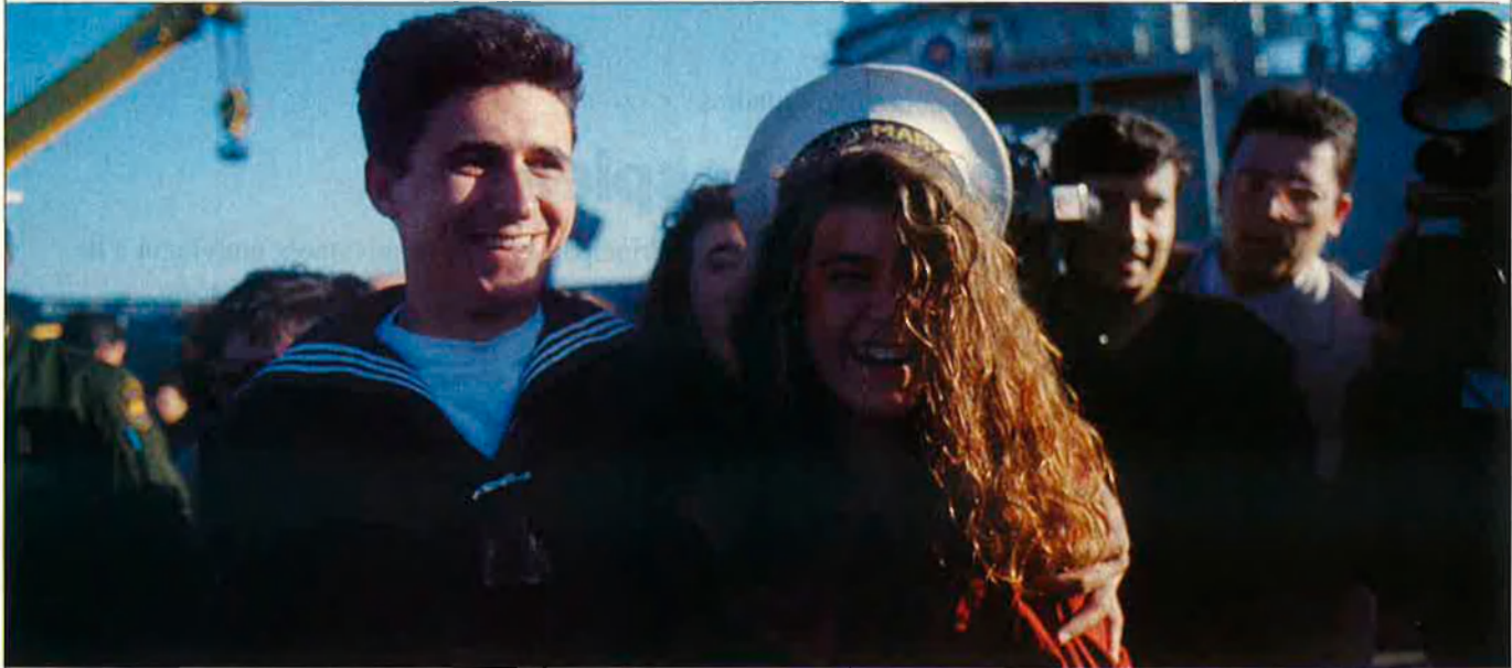
"El ritme de vida que portem en aquest vaicell et fa perdre la noció del temps".