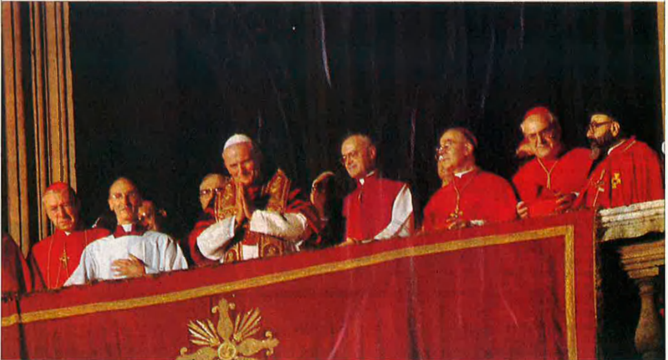
Joan Pau I.

de Polònia, país en què religió i estat estan fortament imbricats, i que una de les idees predominants de Joan Pau II durant el seu pontificat ha estat la constant proposta, com a model, de l'estat cristià. De fet, el Sant Pare té un accentuat interès a evitar que el concepte del sagrat desa-